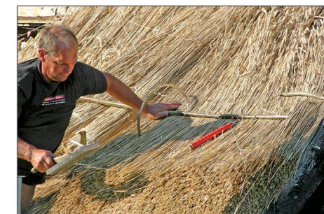
Tækning med langhalm og hasselkæppe