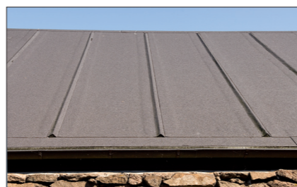
Moderne listedækning i tagpaptag