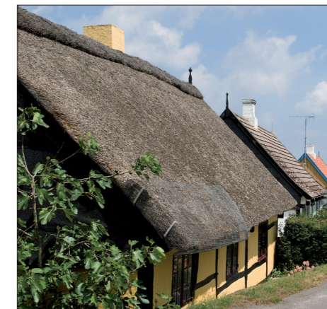
Melsted - strå-, cementtegl- og tegltag

Bornholmske stråtage har nogle særtræk, som bør fastholdes. Det handler om udhængets udformning, vindskeder med husbrande og lyngmønning. Det er mere almindeligt, at de nederste to til tre lægter bæres af skalle. Afskæringen – vinklen - på taget udhæng er midt mellem vandret og vinkelret på tagfladen.