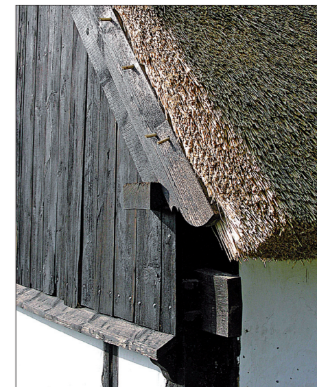
Bræddegavl på bindingsværkshus Bemærk gennemstukne hasselkæppe og udskæring nederst på vindskeden.