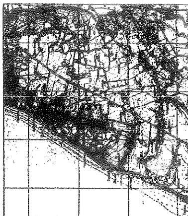
1:5000 - 60 METERS PER INCH (1:150000)