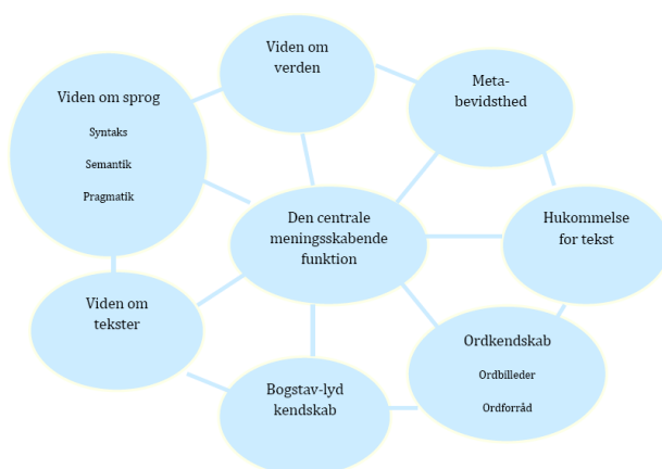
Ehri's interaktive læsemodel