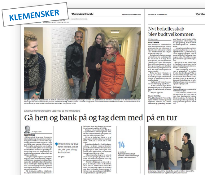
Bornholms Tidende, 19. december 2017

Uanset om efternavnet er Jensen eller Ahmed, har det en stor betydning for at føle sig hjemme, at man tages godt imod på sin nye bopæl, og får en introduktion til fritidsaktiviteter og foreningslivet lokalt.