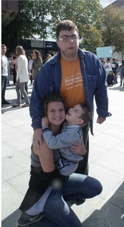
International fredsdag på torvet i Kavadarci sammen med to venner fra projektet med det daglige center for handikappede