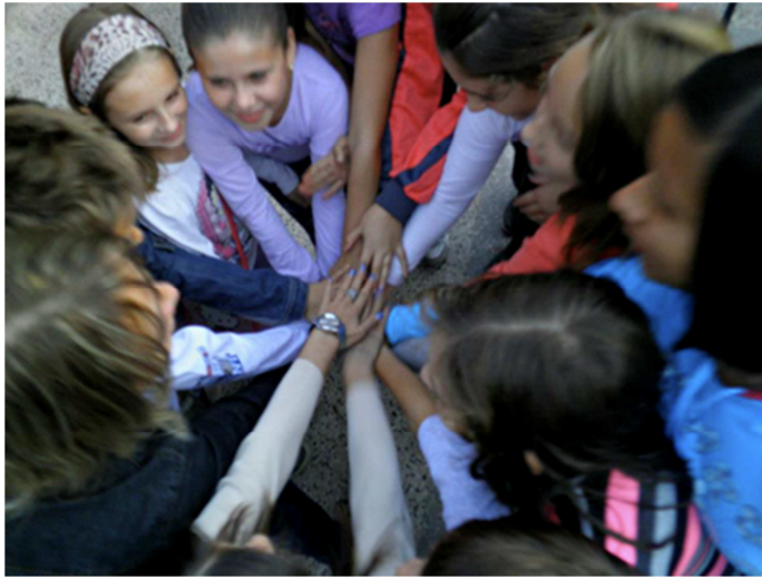
Børn fra engelsk undervisningen

Ligeledes er der en gevaldig sprogbarriere, når jeg underviser mine dejlige 46 børn i engelsk, med hvem kommunikation primært er gennem en makedonsk hjælper (tolk) eller ved kropssprog. Dog er barrieren ikke større end den kan overkommes, hvilket bedst kommer til udtryk i den udvikling antallet af elever har gennemgået, fra at være 10 til i dag at være 46 – med nye hver gang.