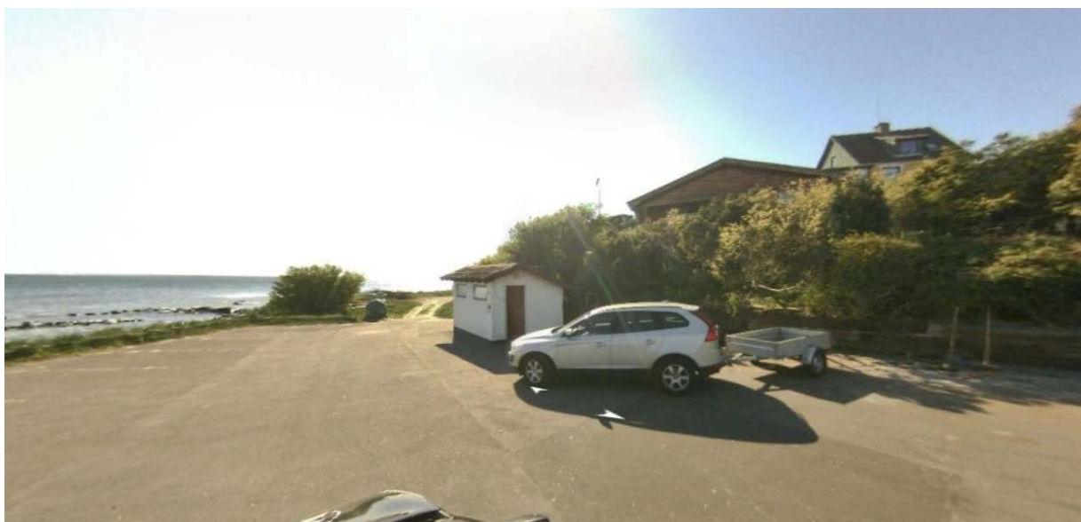
Udsigt fra nærliggende skanse til stedet, hvor caféen placeres – i baggrund ses nærmeste naboejendom.

Arnager og dermed parkeringspladsen, hvor Café Skansen placeres, er beliggende inden for kystnærhedszonen, hvor der ifølge planlovens § 35, stk. 3, kun må gives landzonetilladelse, hvis det ansøgte har helt underordnet betydning i forhold til de nationale planlægningsinteresser i kystområderne. Landskabeligt vurderes cafévogn, container og borde samt stole ikke at udgøre elementer i landskabet, som vil medføre, at nærliggende ejendomme vil miste udsigten til havet, og det vurderes, at projektet er af helt underordnet betydning i forhold til de nationale planlægningsinteresser i kystområdet, idet projektet ikke medfører at der opføres permanente konstruktioner.