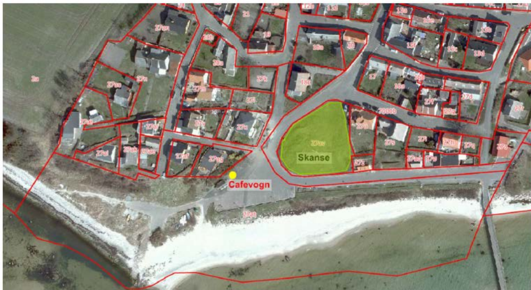
Oversigtskort der viser cafevognens placering i forhold til skansen