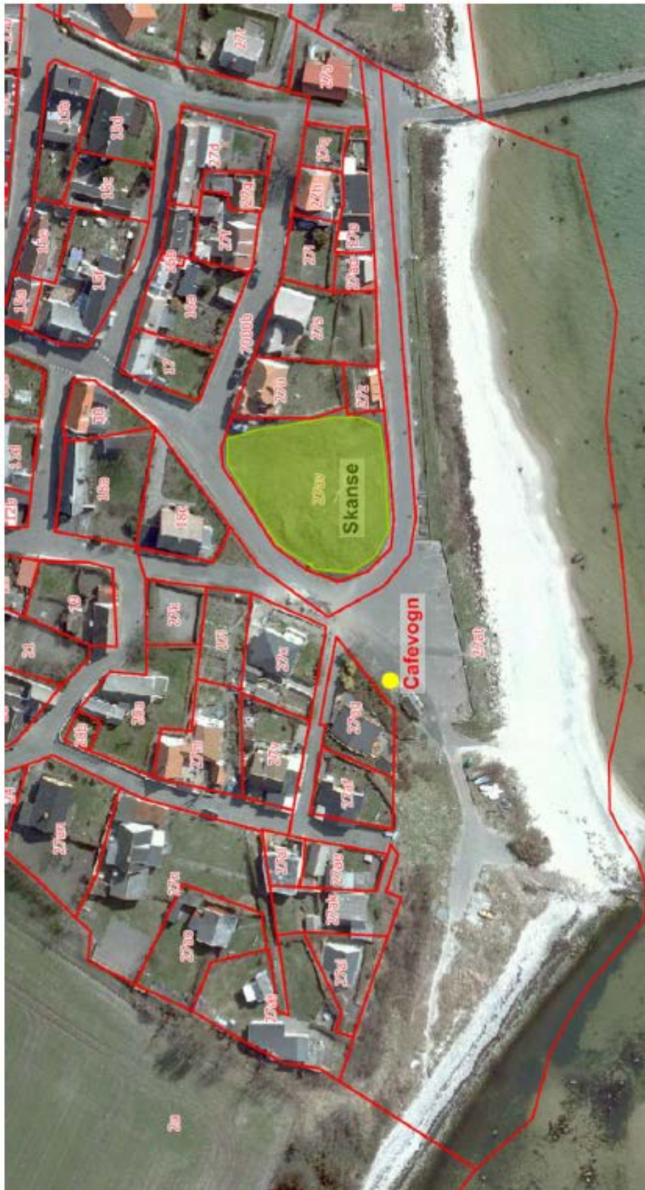
Overigtskort der viser cafevognens placering i forhold til skansen