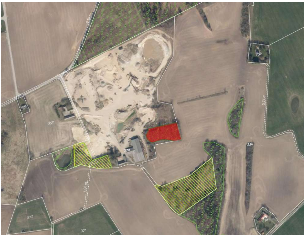
Kort 1. De områder, hvor fredskovspligten ophæves, er markeret med gul skravering. Fredskov er markeret med grøn skovsignatur. Matrikelgrænser er markeret med hvid

Miljøstyrelsen tillader hermed, at fredskovspligten ophæves på en del af matr. nr. 37a Klemensker, som ligger i Bornholms Regionskommune, med henblik på anvendelse af arealet til råstofgravning. Der sker ophævelse af fredskovspligt på ca. 1,51 ha på matr. nr. 37a Klemensker og ca. 0,22 ha på matr. nr. 38d Klemensker. Se nedenstående kort. Det fredskovspligtige areal på 37a Klemensker er herefter på ca. 0,34 ha, og det fredskovspligtige areal på 38d Klemensker er ca. 1,86 ha.