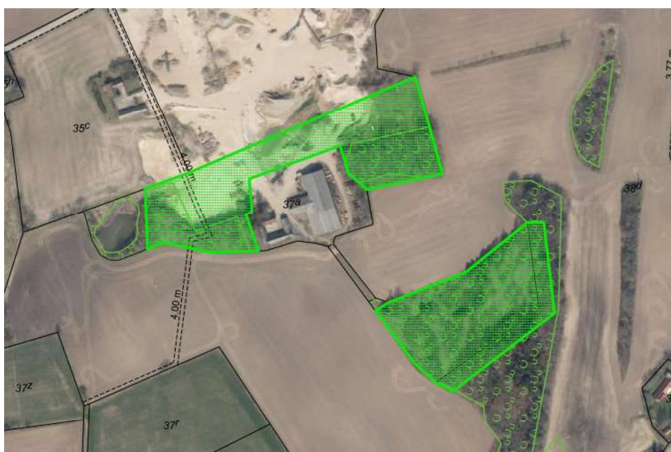
Kort 3. Skovarealer jævnfør efterbehandlingsplanen.

Skovarealerne søges etableret ved naturlig foryngelse, men Miljøstyrelsen vil dog stille krav om, at arealer, som ikke er sprunget i skov 10 år efter indvindingens ophør, skal tilplantes med henblik på at sikre bevoksning på de fredskovspligtige arealer.