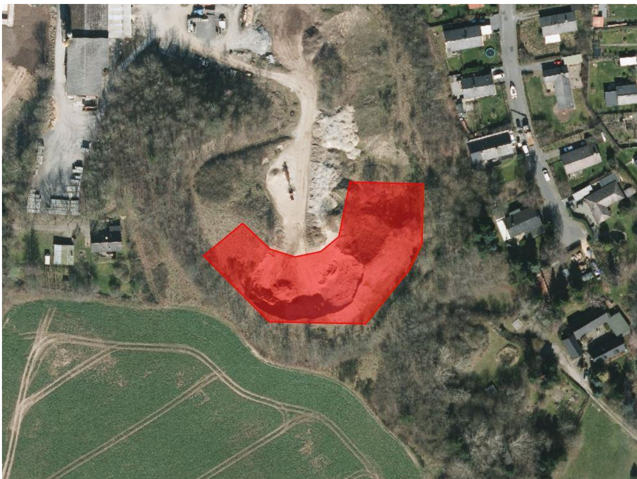
Graveområde markeret med rød