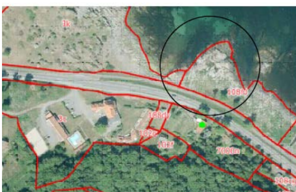
Situationsplan og oversigtskort fra ansøgning