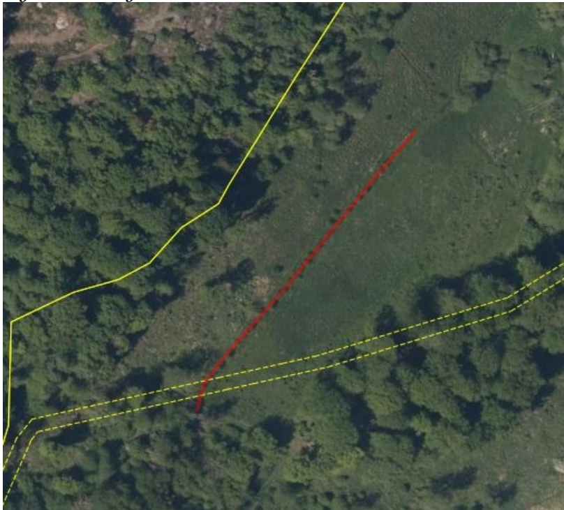
Figur 2. Rød -å strækning der ønskes lukket.

Den afsnørrede del af Læså ønskes tildækket.