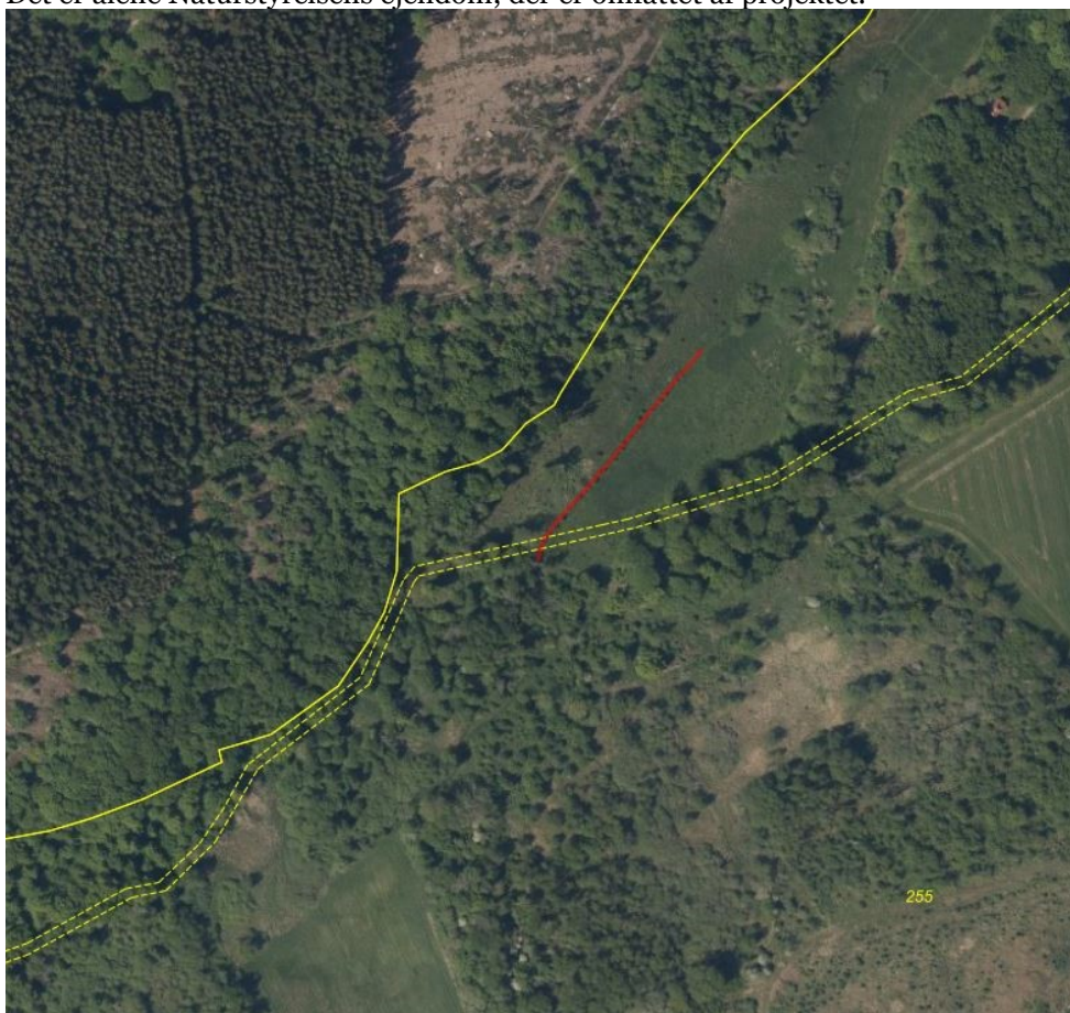
Figur 4. Rød – lokaliteten sydligedel af Ekkodalen. Gul - Naturstyrelsens ejendomsgrænse.

Det er alene Naturstyrelsens ejendom, der er omfattet af projektet.