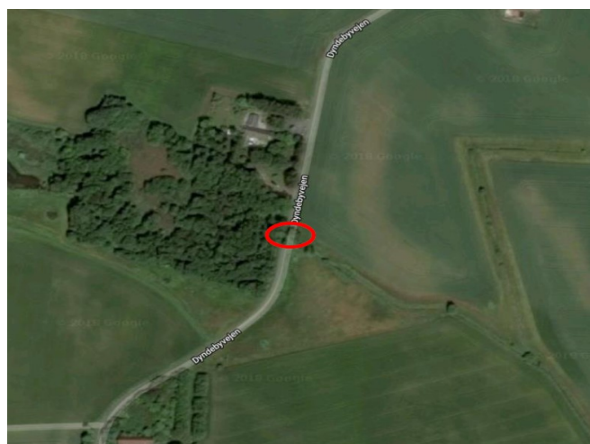
Figur 1: Lokation for bro nr. 3054; Dyndebyvejen, 3730 Nexø.