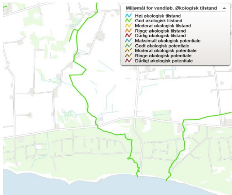
Figur 2: Den grønne linje til venstre, viser linjeføringen for Dammebæk. Den grønne farve angiver, at vandløbet er målsat.

Grøften er ikke målsat, men den leder til Dammebæk, som er målsat til god økologisk tilstand jf. Statens Vandplaner (2010-2015).