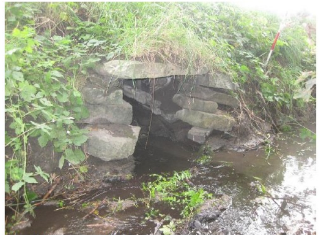
Vestlig facade (indløb)