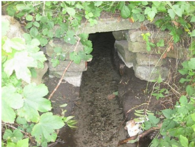
Østlig facade (udløb)