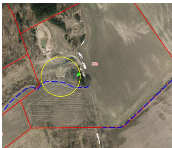
Figur 1: Matrikelkortet viser projektområdet med gul ring og den åbne grøfts placering med en stiple blå linje.

Projektområdet ligger nordvest for Klemensker og ses på følgende kort: