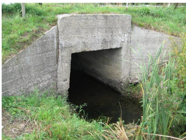
Figur 1. Bro nr. 3021.

Arbejdet forventes udført i sommerperioden 2018. Hjortevej tillades totalafspærret i en periode på 8 uger. Tørholdelsen forventes udført i ca. 4 uger. Vandløbet tørholdes i en begrænset periode i sommerhalvåret, hvor der i forvejen er mindre vandføring. Der etableres lerdæmninger ved ind- og udløb under arbejdets udførelse. Gennemførelse af 2 stk. Ø6000 mm rør, vil sikre fortsat vandføring i vandløbet.