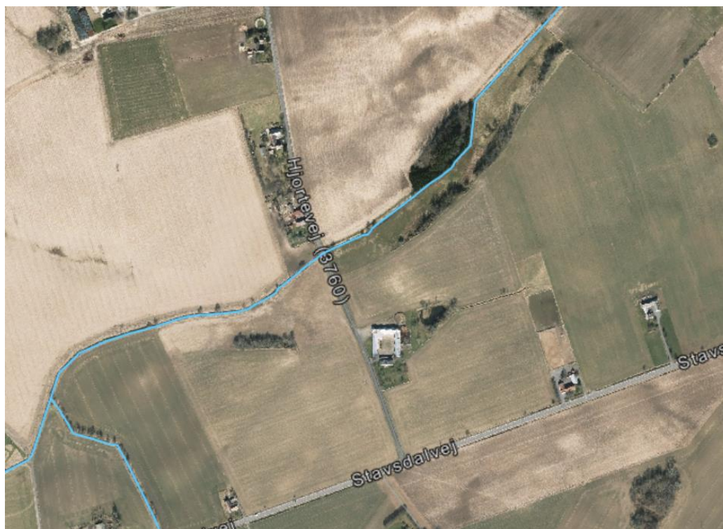
Figur 2 Luftfoto. Med blå streg er vist det beskyttede vandløb.