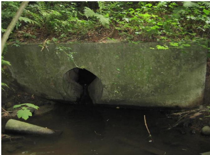
Figur 1. Bro nr. 1518.