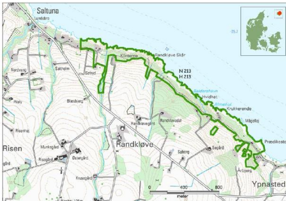
Figur 2. Natura 2000-områdets afgrænsning er identisk med udstrækningen af habitatområde H213 (grøn streg).