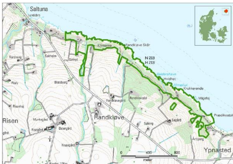
Figur 1 Natura 2000-områdets afgrænsning er identisk med udstrækningen af habitatområde H213 (grøn streg).

Indsatsen udføres af Bornholms Regionskommune og af private lodsejere i området og gennemføres i videst muligt omfang gennem frivillige aftaler. Der findes blandt andet en række tilskudsordninger, som kan søges gennem Landbrugs- og Fiskeristyrelsen samt Miljøstyrelsen.