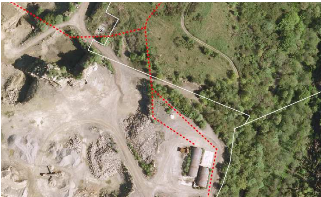
Ill 2. viser hvor vandtilslutning til de tidligere erhvervsbygninger i Vangbruddet. En vandpost vil kunne etableres fx. hvor den tidligere administrationsbygning lå (Ringedalsvej 12), eller hvor de tidligere erhvervsbygninger/ buehaller lå (foto er fra inden nedrivning) .