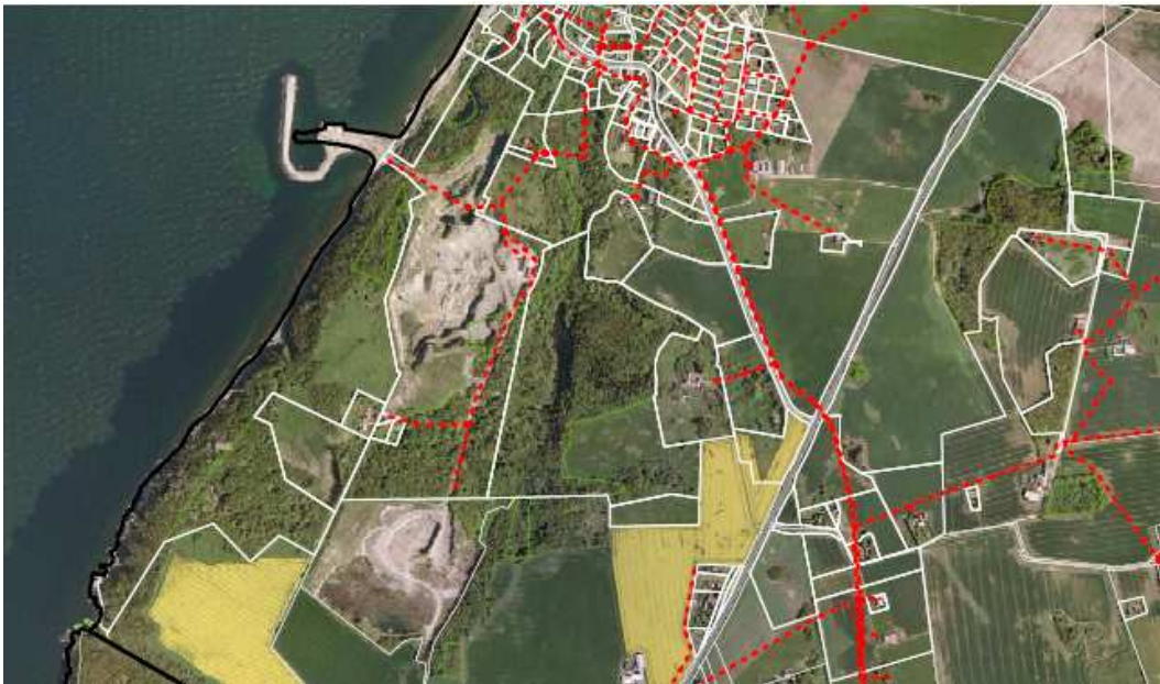
Ill 1. viser de eksisterende rør for vandforsyning i området – markeret med rød stipleet linje.