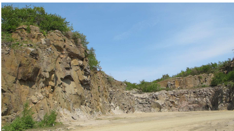
24. Klippeparti – nedre del af Nevadaklippen og tilstødende klippeparti.