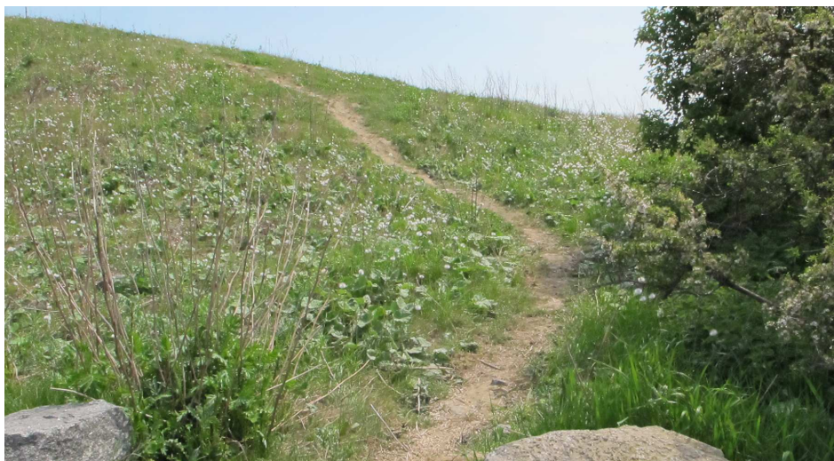
4. Sti, Jorddepot A.