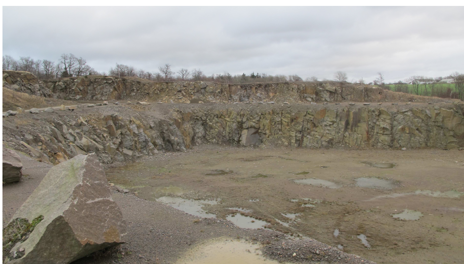
9. Øvre del af Almeløkkebruddet