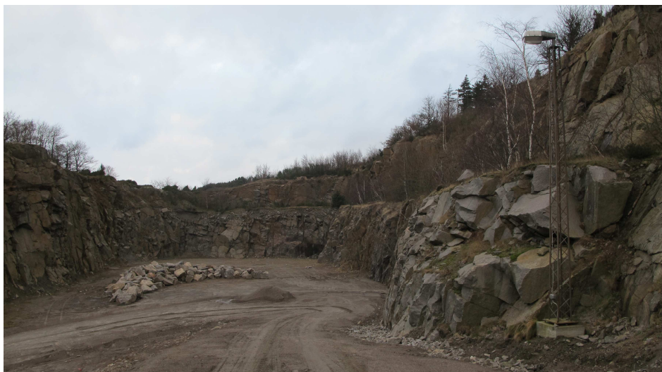
31. Industrilevn. En af tre ens lystmaster langs nedkørslen til pieren, Vangbruddet