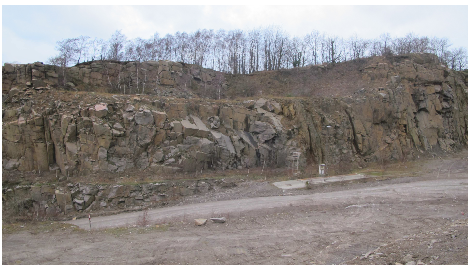
32. Industrilevn. Vægten på vej ned mod Vang Pier, Vangbruddet.