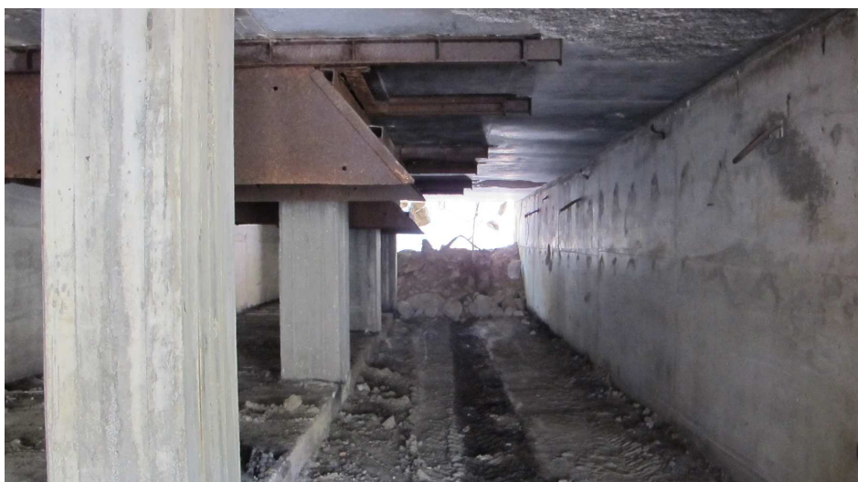
30. Foto indefra sorteringsanlæg, skakter og transportgang