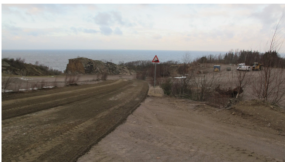
12. Vejens fortsættelse ned gennem Vangbruddet til Vang Pier.