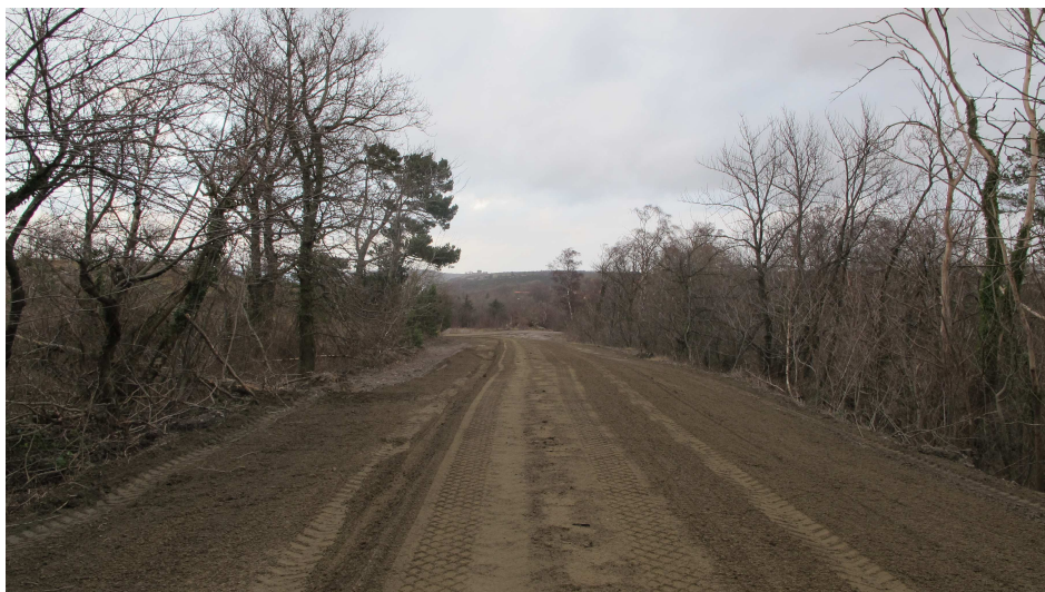
10. Den eksisterende tidligere arbejdsvej der forbinder de to brudområder