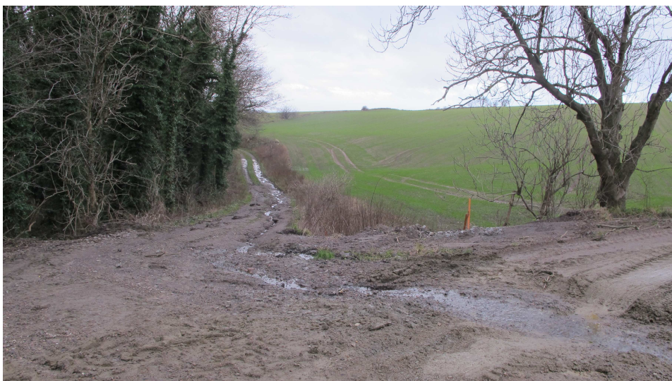
2. Ringedalsvej - strækningen syd om Almeløkkebruddet gennem lavning