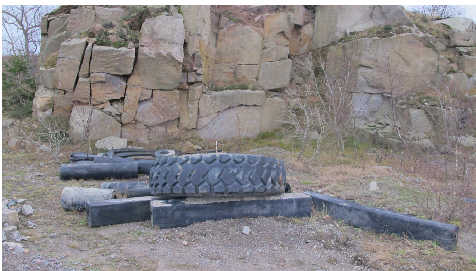
21. Industrilevn. Dæk + fendere (sidstnævnte genanvendes på Vang Pier)