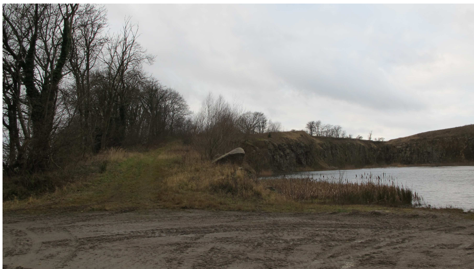
7. Eksisterende sti langs den sydlige kant af Almeløkkebruddet