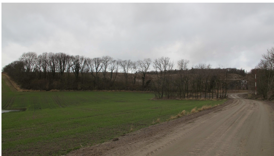
5. Eksisterende P-areal umiddelbart syd for brydningsområdet, Almeløkkebruddet