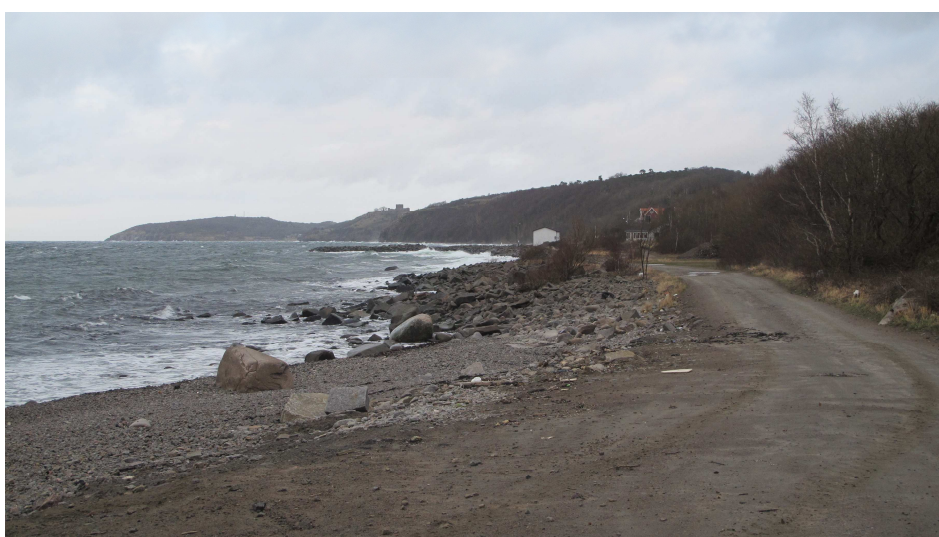
33. Vang Havn. Eksisterende privat fællesvej fra Vang Pier til Vang Havn