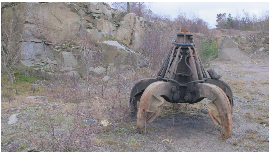
20. Industrilevn. Grab