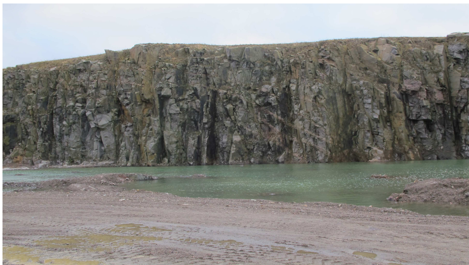
25. Vådområde etableret nedenfor brudkanten mod syd, Vangbruddet