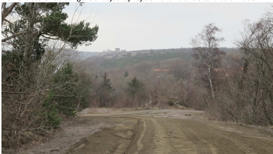
11. Ovennævnte vej umiddelbart inden indkørsel til Vangbruddet