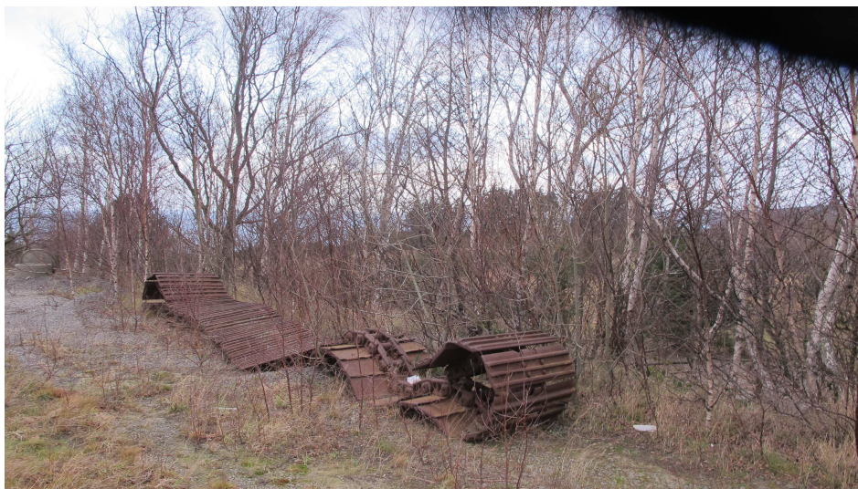
22. Industrilevn. Bælte fra køretøj