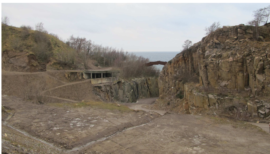
29. Industrilevn. Sorteringsanlæg indbygget i skrænt ovenfor slugten