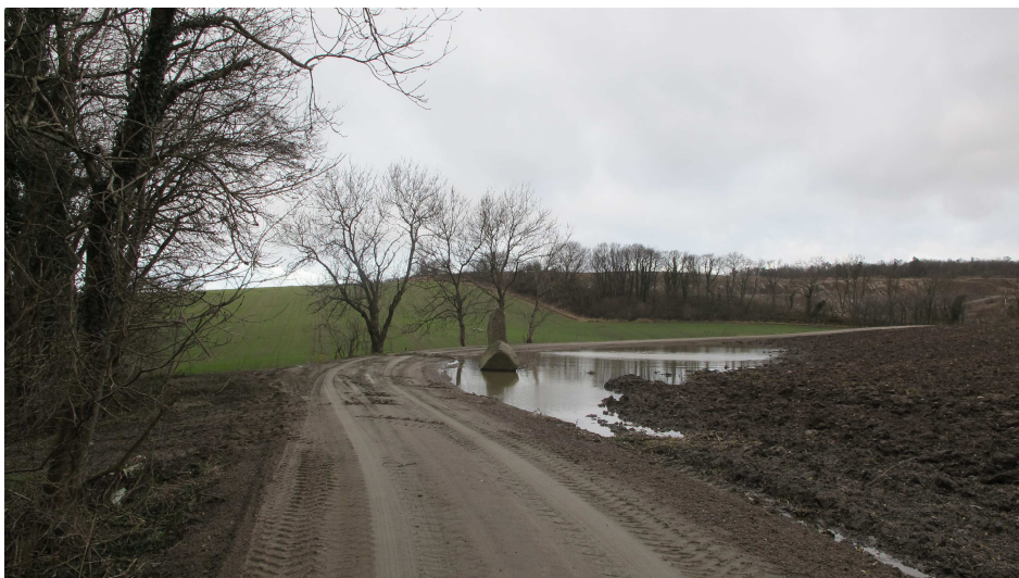
1. Ringedalsvej - Tilkørslen sydfra til Almeløkkebruddet