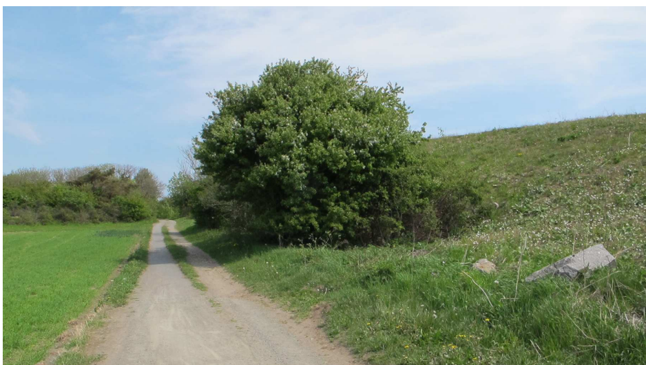
3. Ringedalsvej. Klondyke i skovareal tv., hvor p-plads foreslås i fredningskendelsen