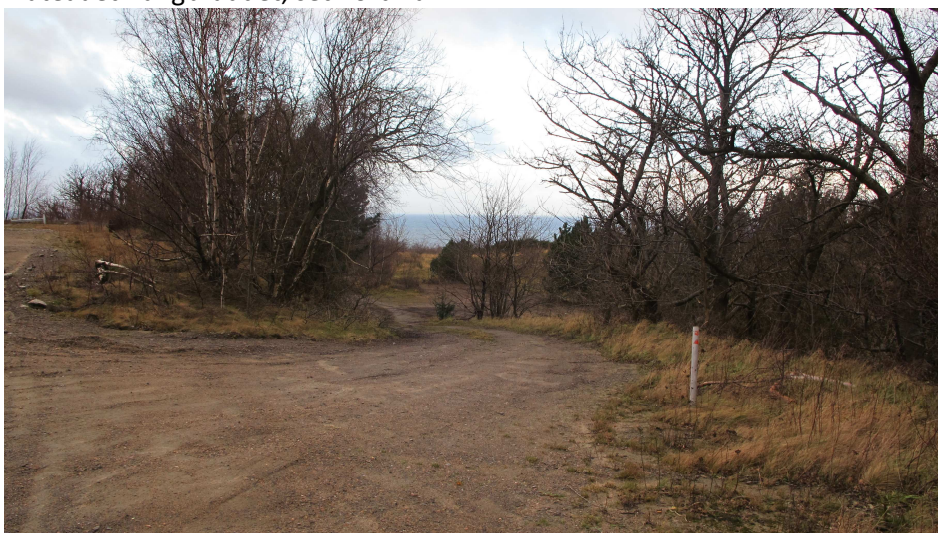
14. Den eksisterende adgangsvej som den løber fra plateauets nordlige kant