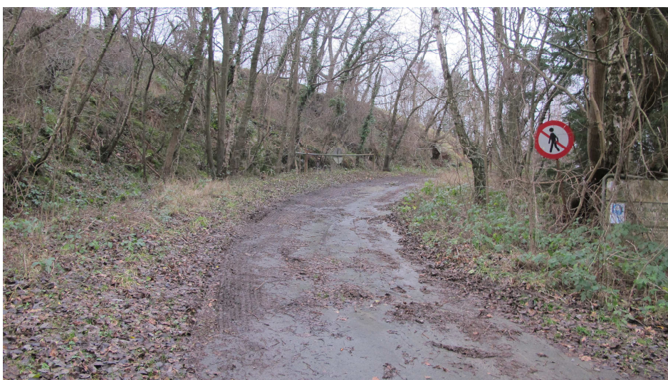
15. Ovennævnte vej set halvvejs nede mod Ringedalsvej.