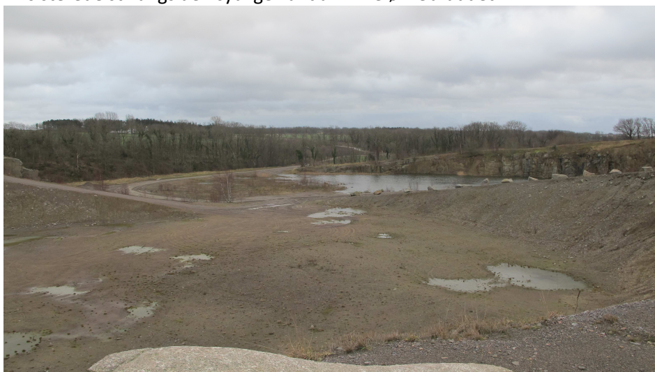
8. Tilbageblik gennem Almeløkkebruddet fra vejen gennem bruddet