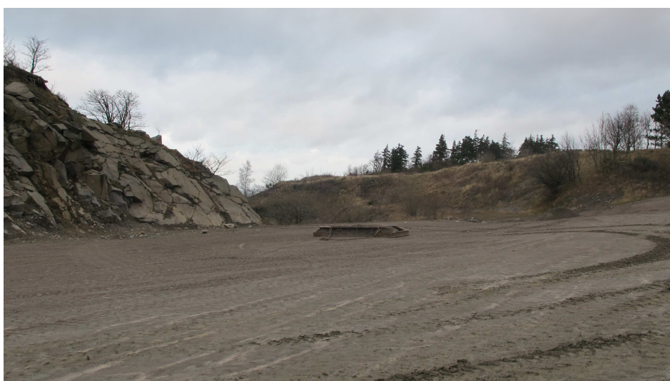
27. Industrilevn. Vejafretter.