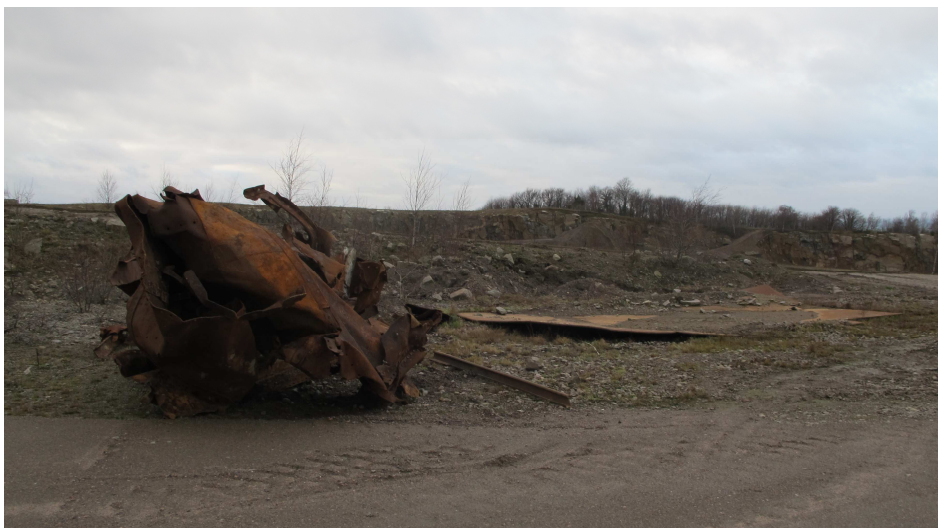
19. Industrilevn. "Maskinskrog" og metalplade vejebod