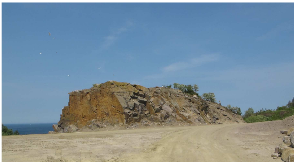
23. Nevadaklippen, set ovenfra.