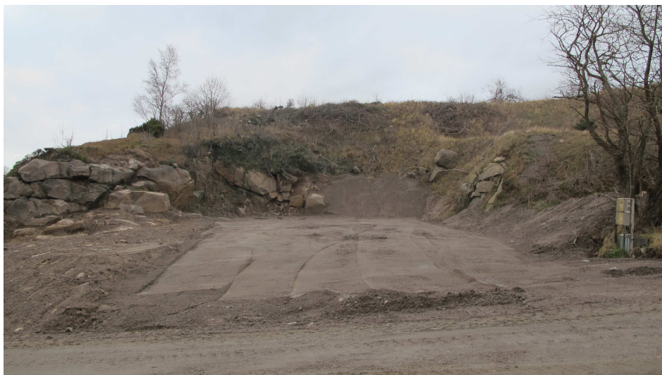
28. Byggetomt, tidligere kontorbygning og vejebod, Vangbruddet