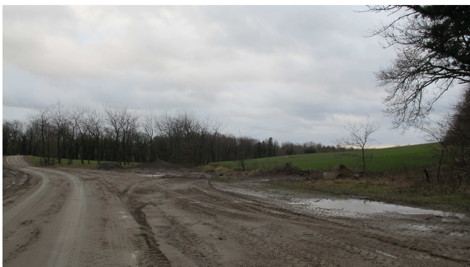
6. Eksisterende P-areal, set inde fra Almeløkkebruddet