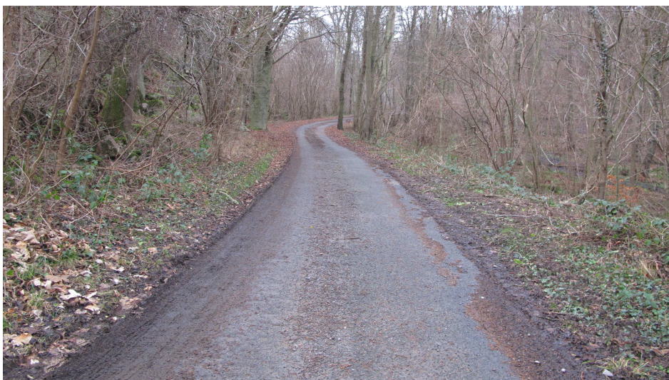
17. Den nordlige del af Ringedalsvej, der også benyttes som regional cykelvej