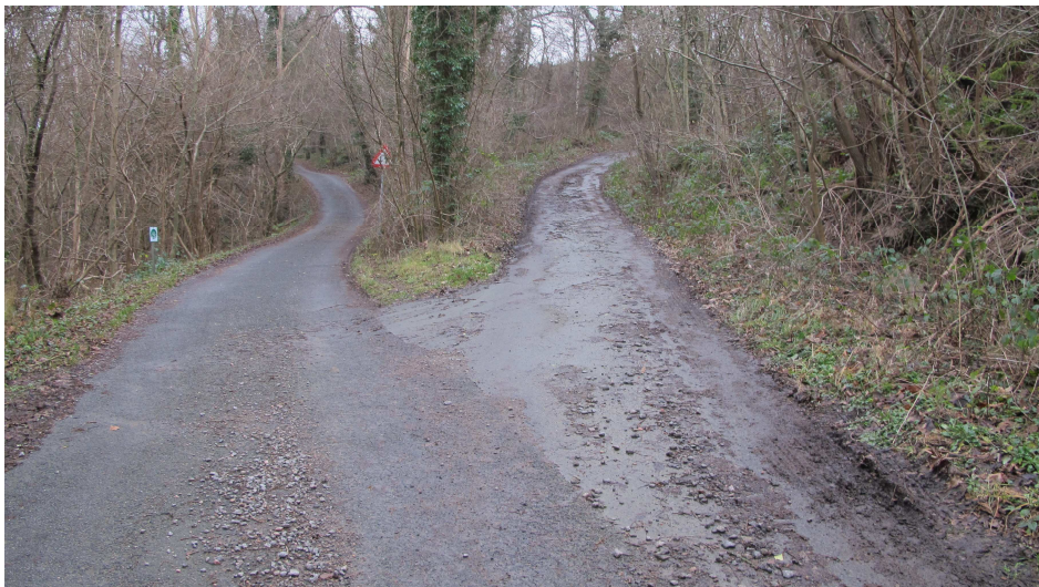
16. Ovennævnte vejforbindelse hvor den løber sammen med Ringedalsvej v. Ringedalen