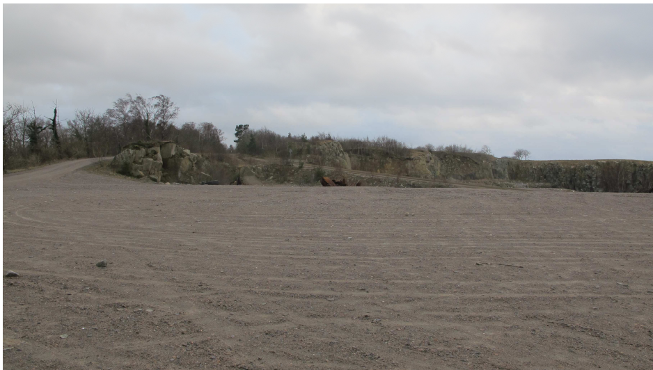
13. Plateauet Vangbruddet, set nordfra