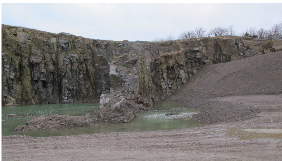
26. Klippeparti i vådområde nedenfor brudkanten, Vangbruddet