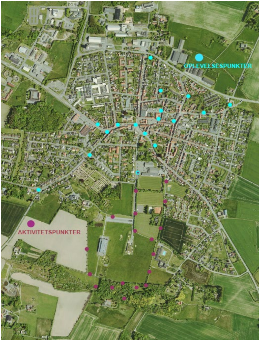
Motionsoase i Bildsø Skov