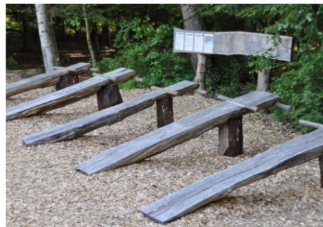
Motionsoase i Skælskør Lystskov